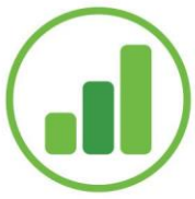
Tabela XX – Nome do quadro (e ponto final após).