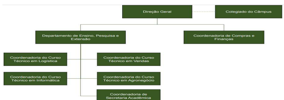
Figura 1: organograma organizacional do IFSC campus de São Lourenço do Oeste: