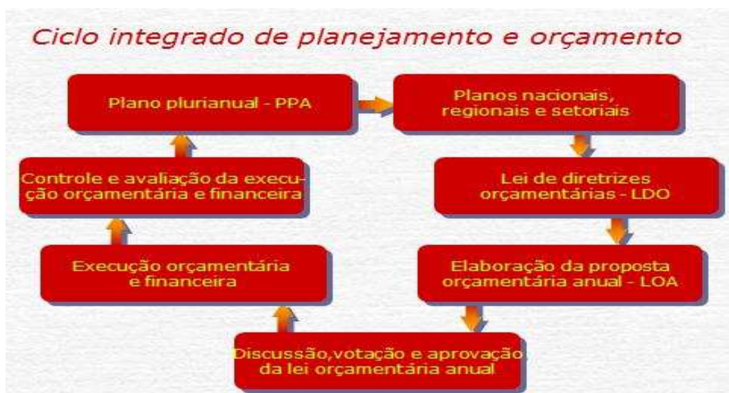
Figura 3: Representação do ciclo integrado de planejamento e orçamento

Na figura 3, pode ser observado o ciclo descrito anteriormente.